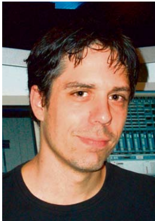
Fabian Römers Musik lässt dem Publikum Platz für eigene Empfindungen.

Ganz und gar nicht. Ein Film als Ganzes, egal welcher Ausrichtung, setzt sich immer aus verschiedenen künstlerischen Faktoren zusammen. Die Musik ist ein wichtiger Teil davon und entsteht in meinem Fall nun mal im Hintergrund. Hauptsächlich fasziniert mich der kreative Prozess: Ich versuche in jeder Produktion, ob Tatort oder Kinofilm, mich in irgendeiner Weise weiterzubringen, sei es etwa durch eine ganz spezielle Klangfarbe oder eine interessante Instrumentierung. Das Renommee hängt stets mit der Quali-